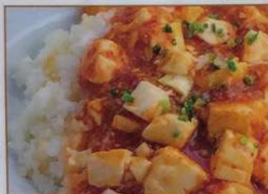
96. 麻婆丼 麻婆盖飯 ¥580