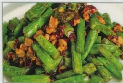
37. インゲンの強火炒め