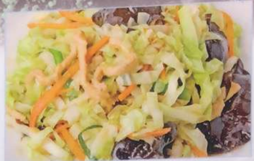
60. 五目野菜炒め 炒五目野菜 ¥680