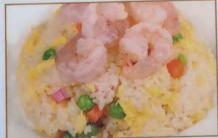
89. 海老炒飯 虾仁炒飯 ¥680