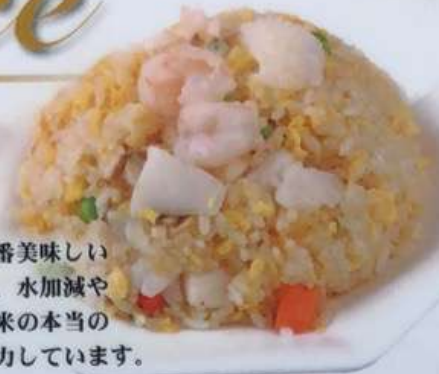
87. 海鮮炒飯 海鮮炒飯 ¥880

いろいろなお米の中から、今一番美味しいと思われるコシヒカリを厳選し、水加減や炊き方にもこだわって、そのお米の本当の美味しさを引き出せるように努力しています。