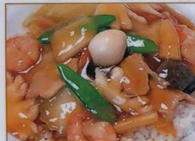
97. 中華丼 中华盖飯 ¥580