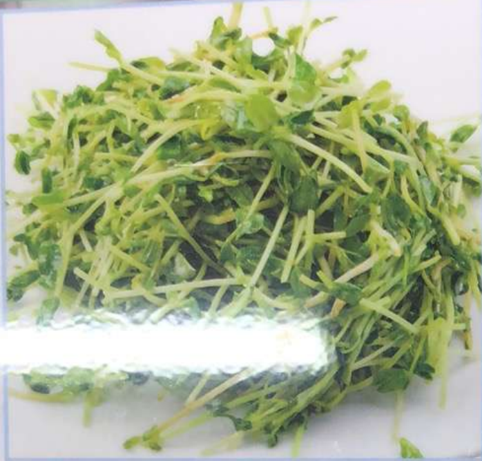
59. 豆苗炒め 炒豆苗 ¥580