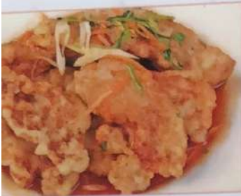
20. 揚げ肉の甘酢かけ 肉包肉