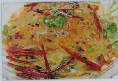
15. マーラー春雨和え