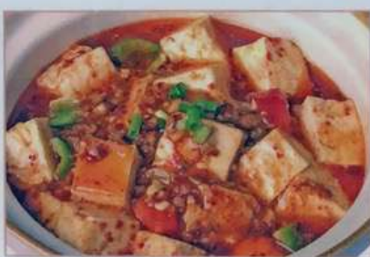
44. 麻婆豆腐土鍋 土锅麻婆豆腐 ¥580