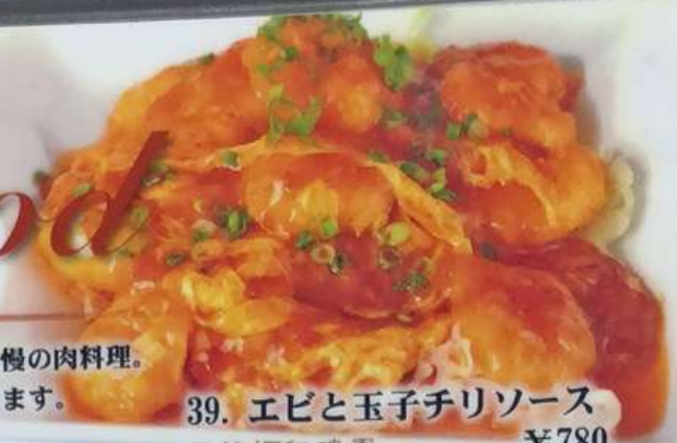
39. エビと玉子チリソース 干焼虾仁鸡蛋 ¥780