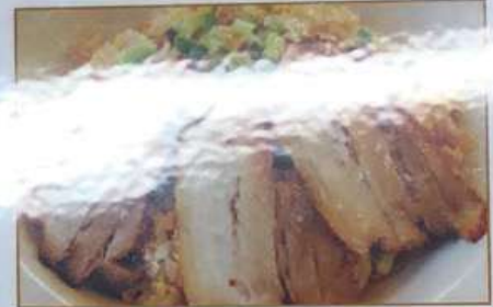
92. チャーシュー炒飯 叉烧炒飯 ¥780