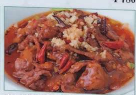
58. 豚肉の四川風激辛煮込み 水煮牛肉