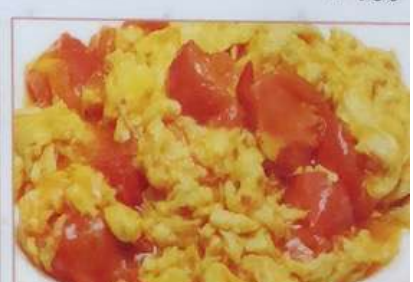
48. トマトと玉子炒め 西红柿炒鸡蛋 ¥680