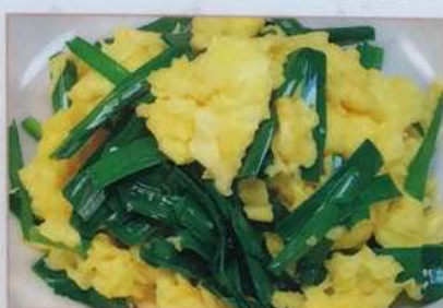
47. ニラと玉子炒め 韭菜炒鸡蛋 ¥580