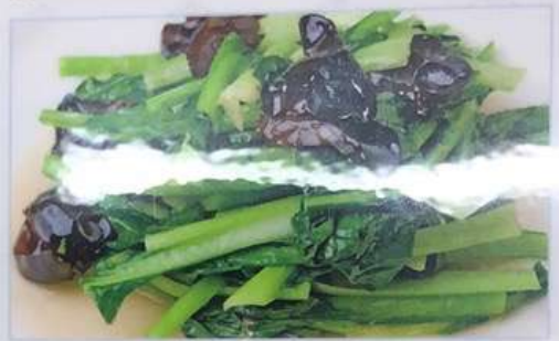
61. 野菜の炒め 炒青菜 ¥580