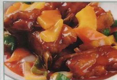
35. スペアリブの甘酢ソース煮込