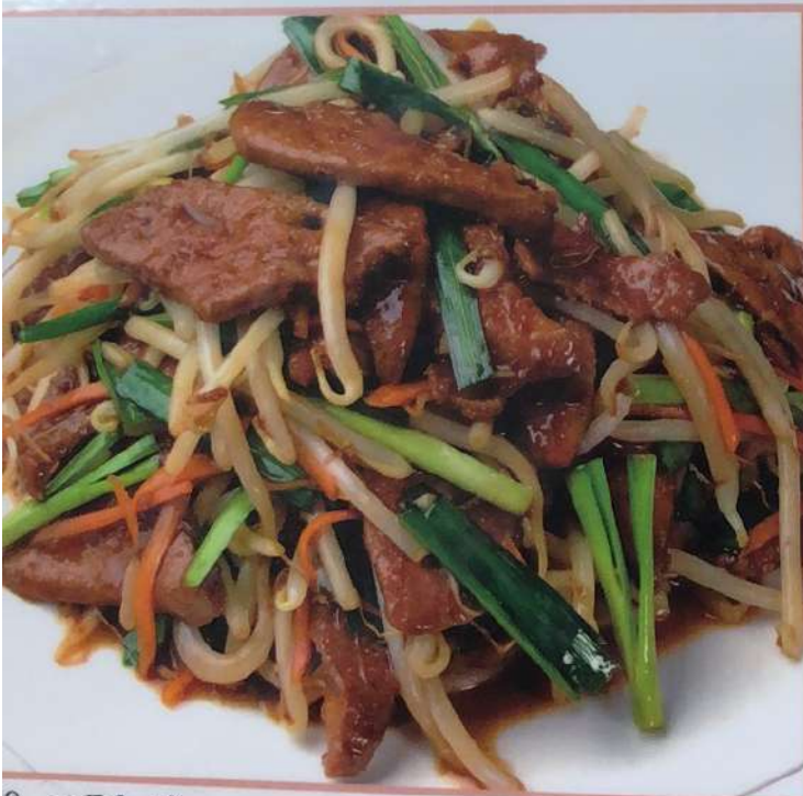
8. ニラレバー 韭菜砂肝 ¥680