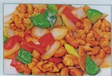
55. 鶏肉とカシューナッツ炒め 腰果鸡丁