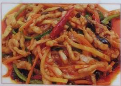
46. 豚肉甘酢辛味炒め 鱼香肉丝 ¥780