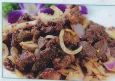
57. 肉とクミン炒め 孜然肉片