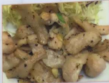
21. トントロの黒胡椒炒め ¥880 黒胡椒 ¥780