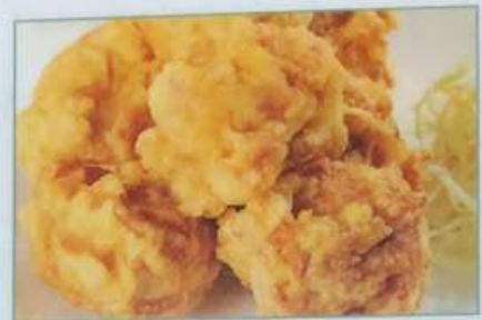
51. 若鳥の唐揚げ 炸鸡块