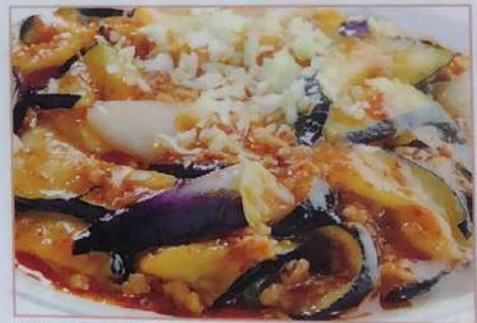
26. 麻婆ナス 麻婆茄子 ¥680