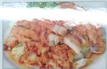
52. ユーリンジー 油淋鸡