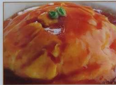
94. 天津丼 天津盖飯 ¥580