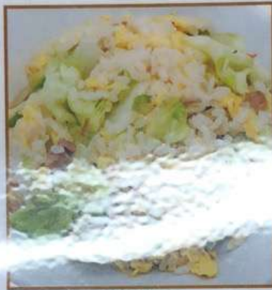
91. レタス炒飯 生菜炒飯 ¥580