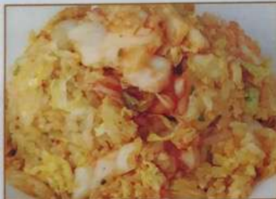
93. キムチチャーハン 泡菜炒飯 ¥580