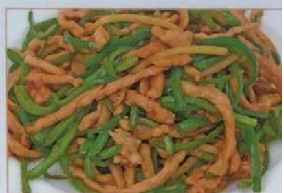
45. 青椒肉絲 青椒肉丝 ¥780