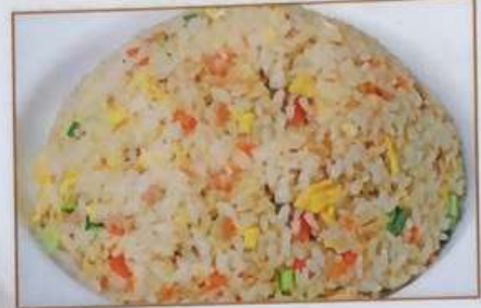
88. 炒飯 炒飯 ¥580