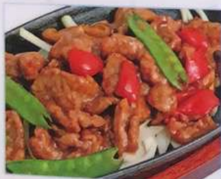
63. 牛肉の鉄板焼き 鉄板牛肉 ¥880