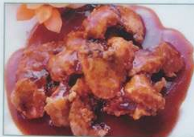
53. 若鶏の唐揚げの黒酢ソースかけ 黑祖鸡