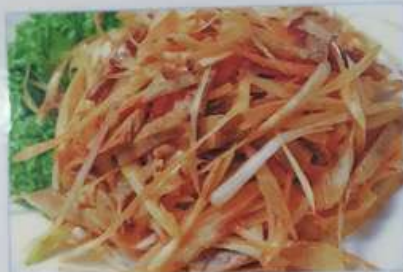
14. ネギとチャーシュー和え