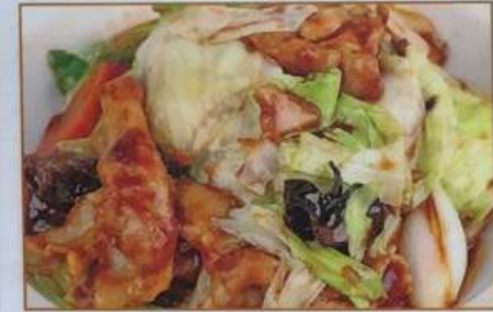
95. ホイコーロー丼 回锅肉盖飯 ¥680