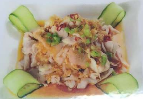
25. ニンニク肉和え 蒜泥白肉 ¥680