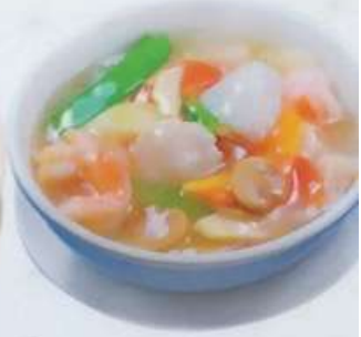
49. 海鮮おこげ 海鮮鍋巴