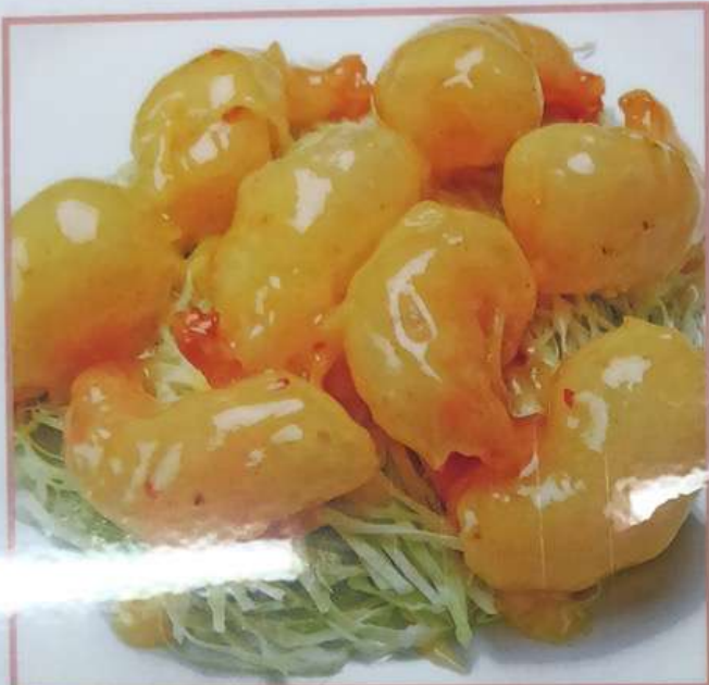
40. エビマヨネーズ 富贵虾仁 ¥880