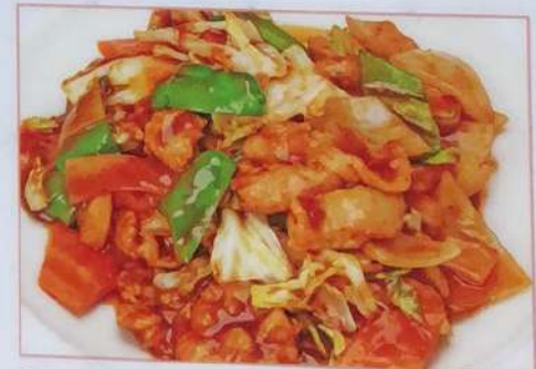
27. ホイコーロー 回锅肉 ¥680