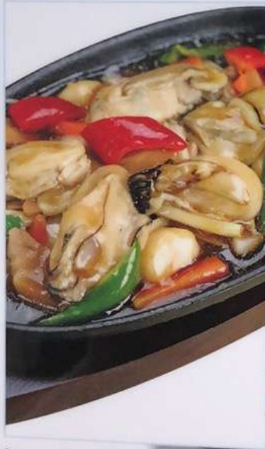
64. カキの鉄板焼き 鉄板海蛎 ¥880