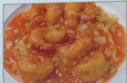
41. エビチリソース 干焼虾仁 ¥780