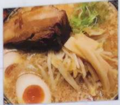
76. 味噌角煮麵 味噌扣肉面 ¥780