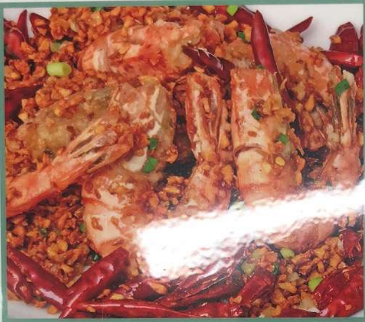
30. 大海老のマーラー炒め