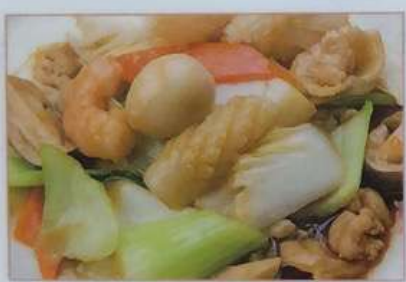
43. 八宝菜 八宝菜 ¥680