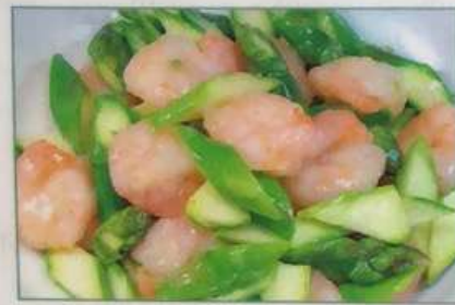
36. アスパラとエビ炒め