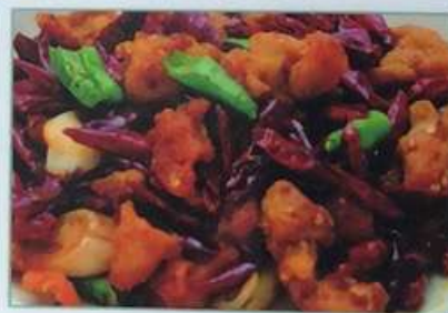
54. 鶏肉の四川香辛料揚げ 香辣鸡