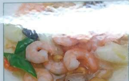
42. エビとカシューナッツ炒め 腰果虾仁 ¥880