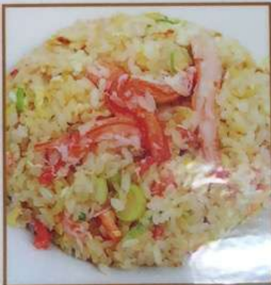
90. カニ風バター炒飯 黄油蟹肉炒飯 ¥780