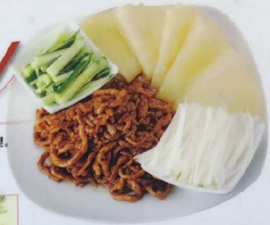
24. ●肉の特製味噌細切り炒め 京酱肉丝 ¥980