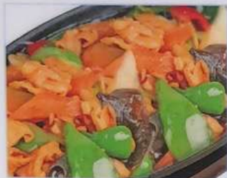
62. ホルモンの鉄板焼き 鉄板肥腸 ¥780