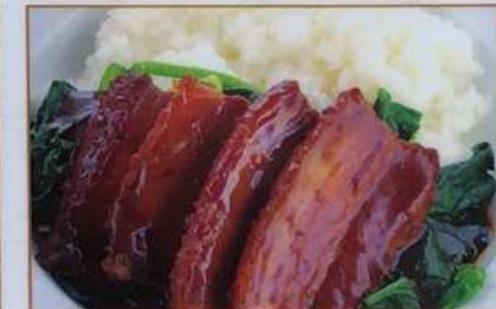
98. 角煮丼 扣肉盖飯 ¥780