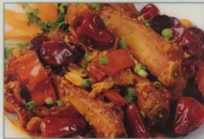
34. スペアリブの辛味炒め