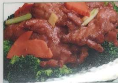
31. 牛肉のマーラー炒め