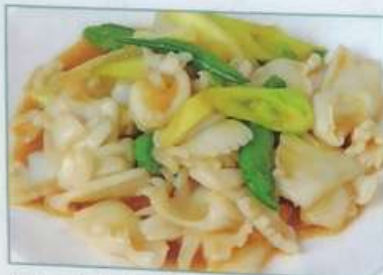
56. イカとネギの炒め 葱炒鱿鱼