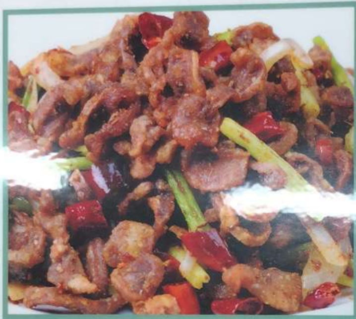
50. 砂肝とクミン炒め 孜然鸡胗